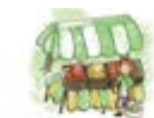
Marché de Plein Vent