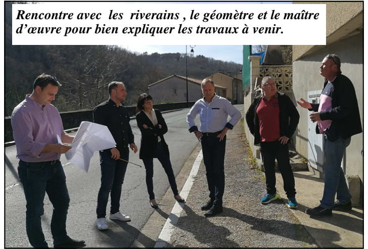
Rencontre avec les riverains, le géomètre et le maître d'œuvre pour bien expliquer les travaux à venir.