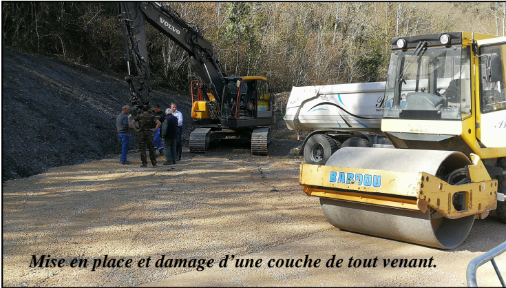
Mise en place et damage d'une couche de tout venant.