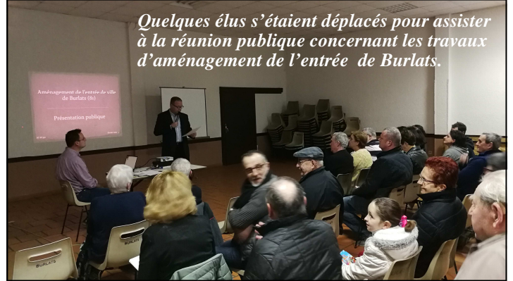
Quelques élus s'étaient déplacés pour assister à la réunion publique concernant les travaux d'aménagement de l'entrée de Burlats.