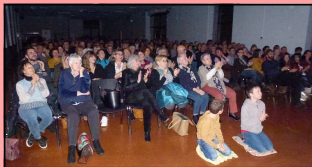
Le public conquis par le jeu des acteurs.