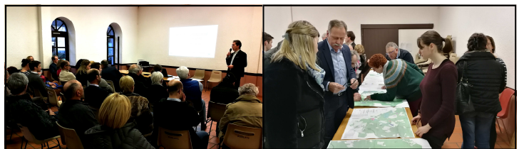
Lors de la réunion publique portant sur le PLUI, après un apport technique, consultation des cartes.

La première tranche des travaux de réaménagement de l'entrée du village de Burlats avance à grands pas.