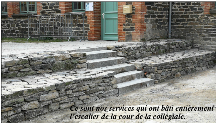
Ce sont nos services qui ont bâti entièrement l'escalier de la cour de la collégiale.