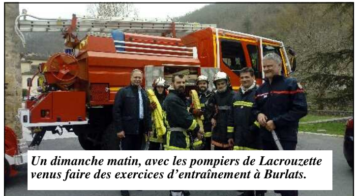
Un dimanche matin, avec les pompiers de Lacrouzette venus faire des exercices d'entraînement à Burlats.