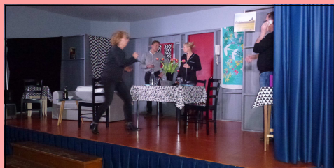
Les 4 acteurs sur scène en même temps.

Organisée par la mairie, cette soirée a attiré 170 personnes environ. La qualité de la troupe ainsi que le prix très abordable (5€ l'entrée) y sont sans doute pour beaucoup dans ce succès, ce qui incite la municipalité à renouveler ce type d'animation.