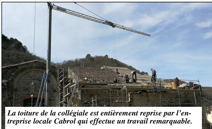
La toiture de la collégiale est entièrement reprise par l'entreprise locale Cabrol qui effectue un travail remarquable.