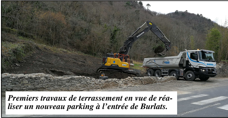
Premiers travaux de terrassement en vue de réaliser un nouveau parking à l'entrée de Burlats.