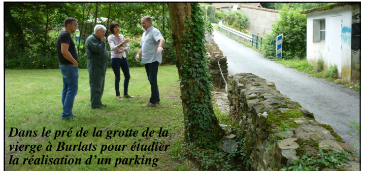
Dans le pré de la grotte de la vierge à Burlats pour étudier la réalisation d'un parking

En différents lieux de la commune pour évaluer les dégâts suite aux dernières intempéries des mois de mai et juin.