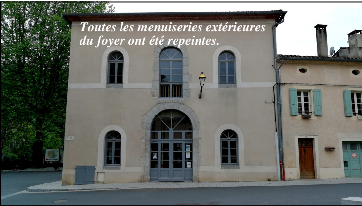
Toutes les menuiseries extérieures du foyer ont été repeintes.