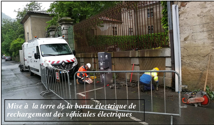
Mise à la terre de la borne électrique de rechargement des véhicules électriques