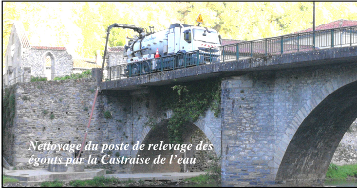
Nettoyage du poste de relevage des égouts par la Castraise de l'eau