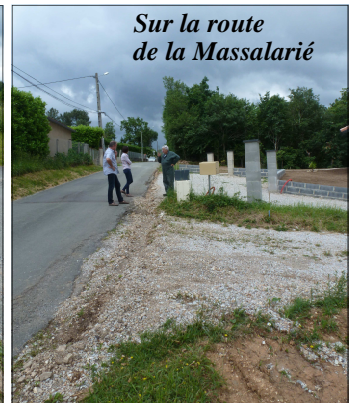
Sur la route de la Massalarié