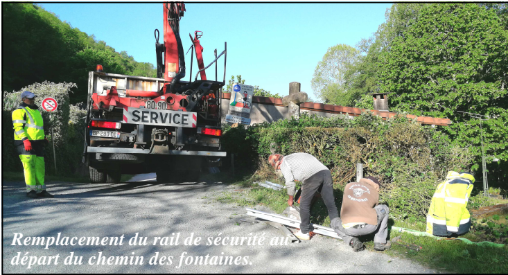
Remplacement du rail de sécurité au départ du chemin des fontaines.