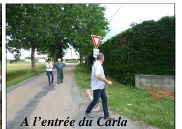
A l'entrée du Carla