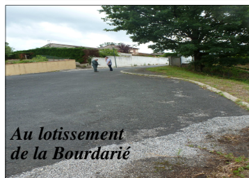
Au lotissement de la Bourdarié