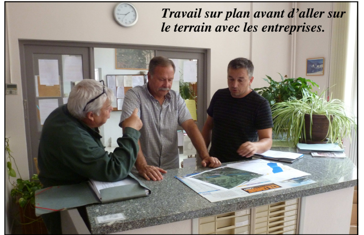
Travail sur plan avant d'aller sur le terrain avec les entreprises.