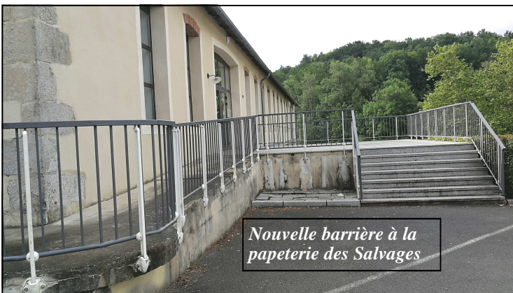
Nouvelle barrière à la papeterie des Salvages