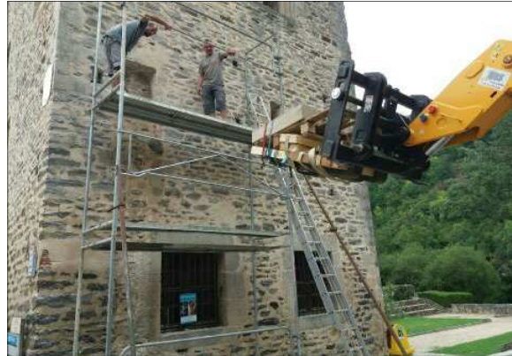
Mise en place du blason