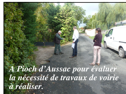
A Pioch d'Aussac pour évaluer la nécessité de travaux de voirie à réaliser.