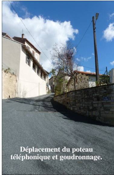
Déplacement du poteau téléphonique et goudronnage.

Île : suite aux dernières inondations du mois de février dernier, les berges de l'île ainsi que le parcours de descente de canoé avaient été fortement endommagés. Il a fallu réparer la passerelle et reprendre les enrochements qui avaient cédé sous la puissance des flots. Ces travaux étaient plus que nécessaire pour la sécurité des lieux toujours très prisés par les touristes aux beaux jours.