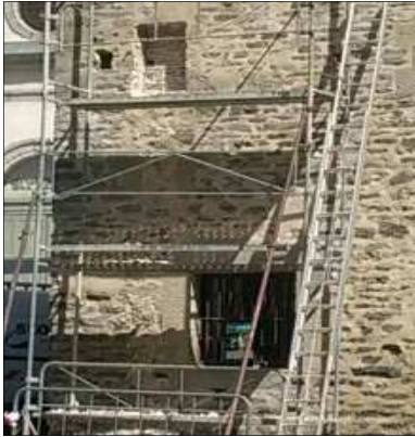
L'ouverture est créée pour recevoir le blason