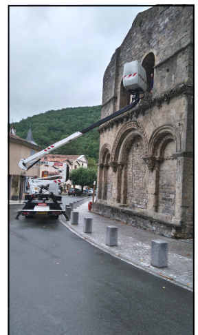
La nacelle de la communauté des communes nous a été fort utile lors de l'installation de la climatisation.