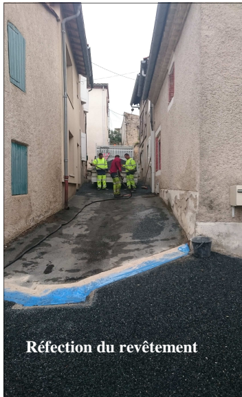
Réfection du revêtement

Voirie : La réhabilitation (traitement de l'écoulement des eaux pluviales et regoudronnage, éclairage) de l'ensemble des rues du quartier de la Bracadelle aux Salvages était plus que nécessaire.