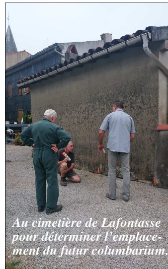
Au cimetière de Lafontasse pour déterminer l'emplacement du futur columbarium.