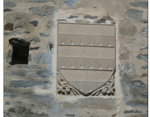
Les armoiries des Trencavel