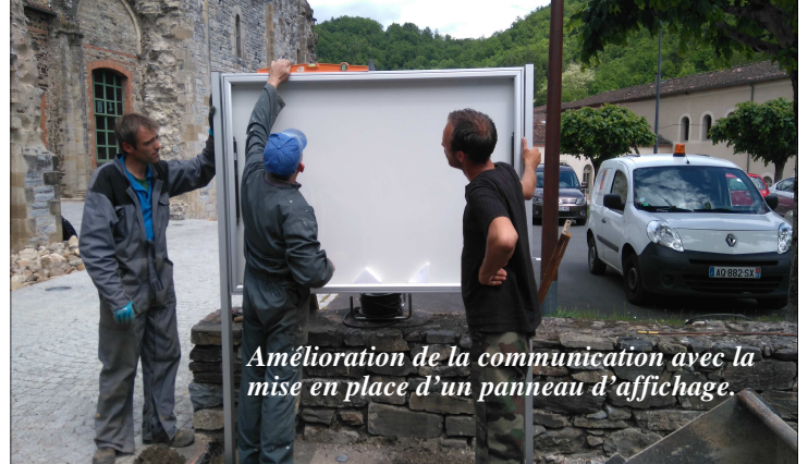
Amélioration de la communication avec la mise en place d'un panneau d'affichage.