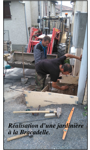
Réalisation d'une jardinière à la Bracadelle.