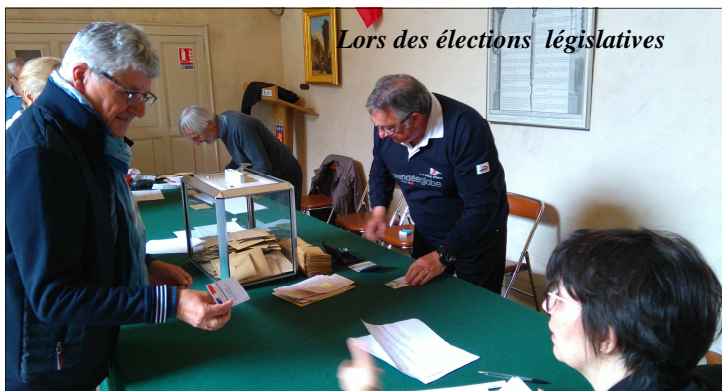
Lors des élections législatives