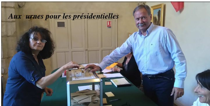
Aux urnes pour les présidentielles

Durant quatre week-end, tous les élus se sont mobilisés afin d'organiser et d'assurer le bon déroulement des élections présidentielles et législatives.