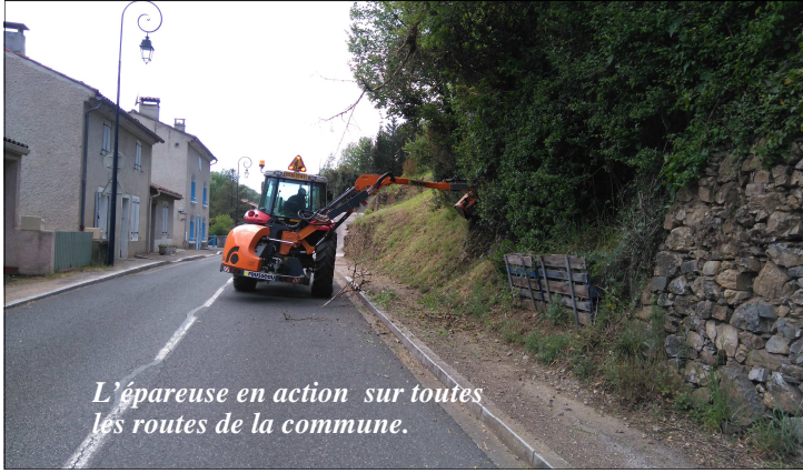
L'épaveuse en action sur toutes les routes de la commune.