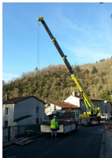
Réalisation d'une barrière de sécurité en béton : travaux effectués par le Conseil Général.