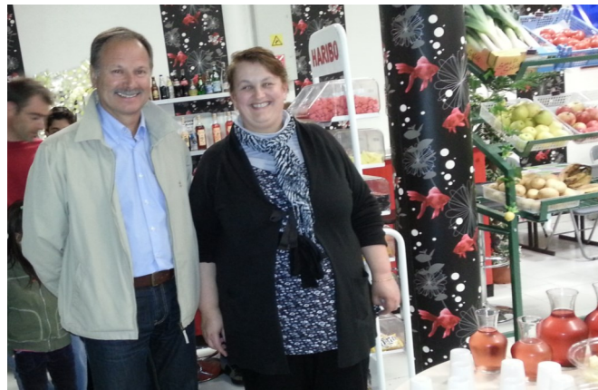
Monsieur le Maire chez Mano lors de l'inauguration de l'épicerie et du point poste de Burlats