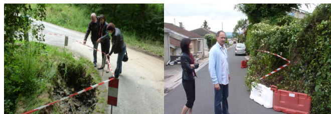
Effondrement au ruisseau de Rivassel Eboulement d'un talus à la Bracadelle

Les élus se sont déplacés en différents lieux de la commune pour mieux constater les dégâts suite aux fortes pluies et pouvoir ainsi programmer les travaux à effectuer. Ci-dessus, deux exemples