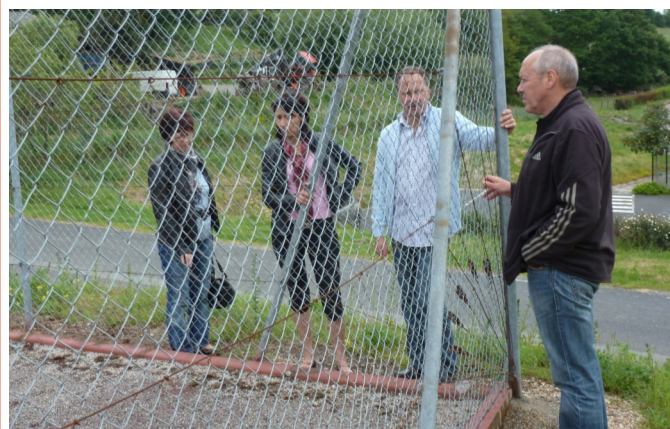
Au terrain de sport des Vignals en vue d'un réaménagement du terrain de tennis

Les élus se sont déplacés en différents lieux de la commune pour mieux constater les dégâts suite aux fortes pluies et pouvoir ainsi programmer les travaux à effectuer. Ci-dessus, deux exemples