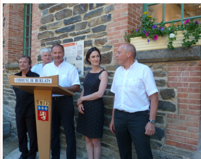
Inauguration de la salle d'honneur de la collégiale et vernissage de l'exposition