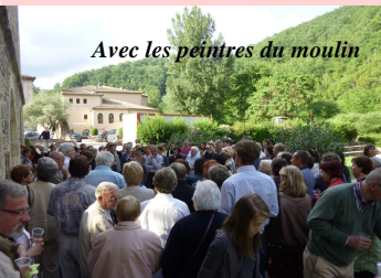
Avec les peintres du moulin

à Burlats, plus de chance pour les organisateurs qui ont bénéficié d'une météo clémente. La coopération entre le Racing Club Salvageois et Burlats Animation a permis, malgré les travaux en cours, à plus de cent exposants répartis dans tout le village de proposer de bonnes affaires à tous les amateurs.