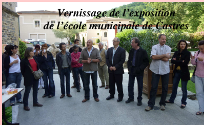
Vernissage de l'exposition de l'école municipale de Castres

Rappelons que d'autres expositions dont vous pouvez lire le calendrier dans cette page se succéderont jusqu'au 20 septembre.