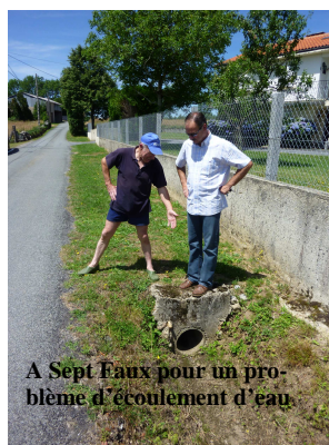
A Sept Faux pour un problème d'écoulement d'eau.

Nouveauté : tous les premiers mardis du mois, les élus se déplacent sur le terrain pour rencontrer les administrés ou pour évaluer les éventuels travaux à réaliser.