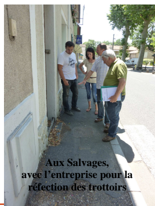
Aux Salvages, avec l'entreprise pour la réfection des trottoirs