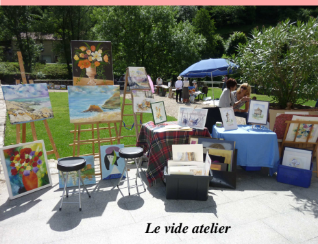
Le vide atelier

La saison touristique et artistique du Pavillon Adélaïde.