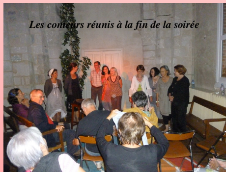
Les conteurs réunis à la fin de la soirée