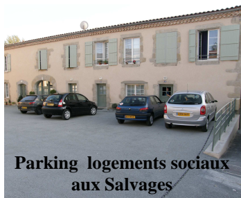
Parking logements sociaux aux Salvages

Les services de la communauté des communes ont profité des beaux jours de la fin septembre pour réaliser divers travaux de goudronnage