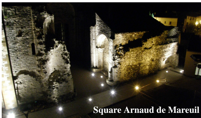
Square Arnaud de Mareuil

La mise en service de l'éclairage du parking et des abords de la collégiale est venue, après l'engazonnement des espaces verts, clôturer les travaux de requalification du square Arnaud de Mareuil.