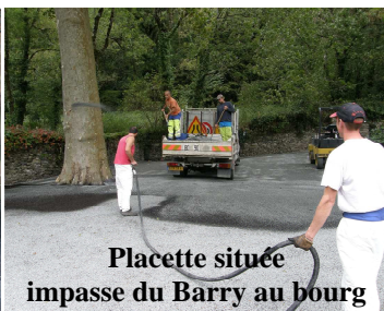
Placette située impasse du Barry au bourg