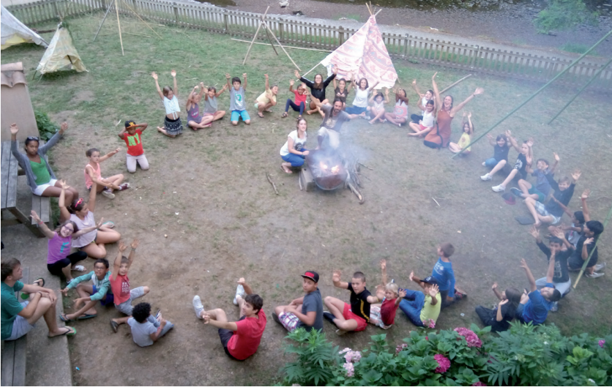
2016, les 20 ans du Moulin des Sittelles.

Le Moulin des Sittelles propose trois activités principales :