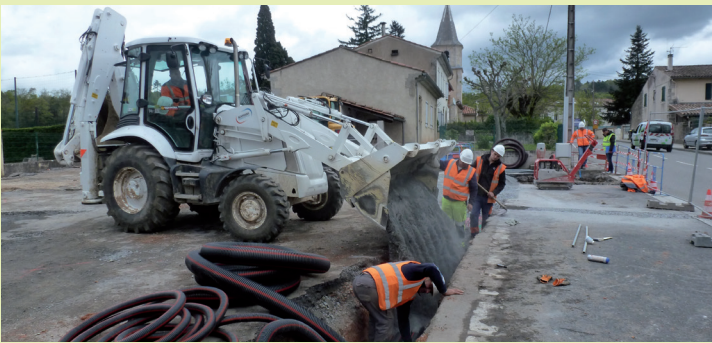
Enfouissement des réseaux électriques et téléphoniques.