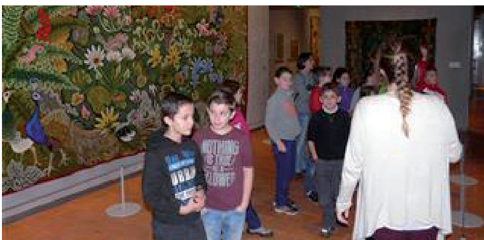
Sortie à Sorèze au musée Dom Robert.