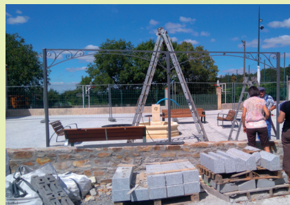
Montage de la tonnelle.