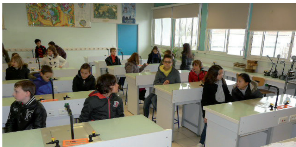
Action de liaison avec le collège Jean Monnet.