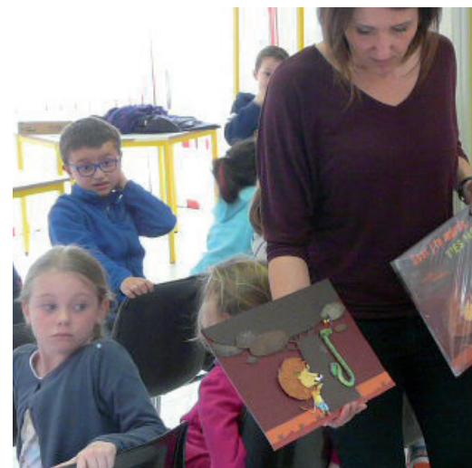
Rencontre avec une illustratrice d'albums de littérature.