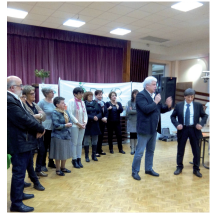
Discours lors des 60 ans de l'ADMR