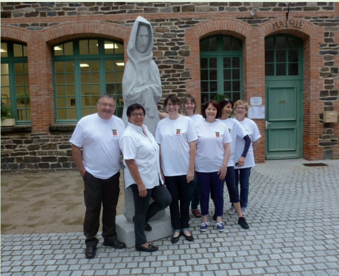
Jury prêt au départ pour les visites.

Le concours communal des maisons et balcons fleuris a vu le jour il y a maintenant une quinzaine d'années. Succédant à M.C Marty, Geneviève Vialatte a conduit en solo cette édition avec une nouveauté dans les prix : un panier gourmand venant récompenser les participants.