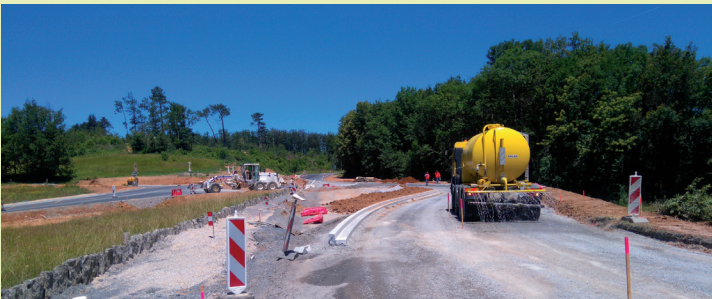
Jonction entre le haut du contournement et la sortie du village.