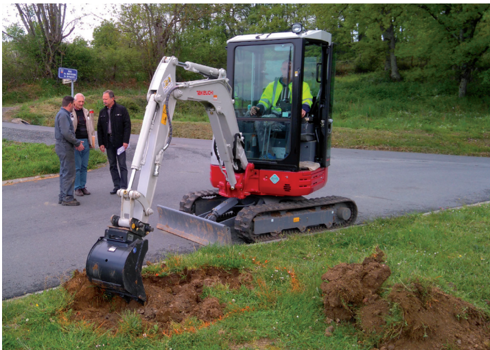
Essai d'une mini-pelle avant de réaliser son investissement.