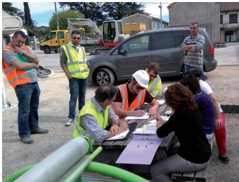
Réunion de chantier tous les mardis pour l'aménagement du cœur de village de Lafontasse.