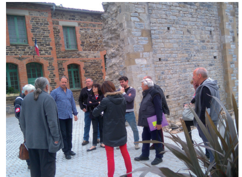
Préparation de la fête médiévale avec les troupes.