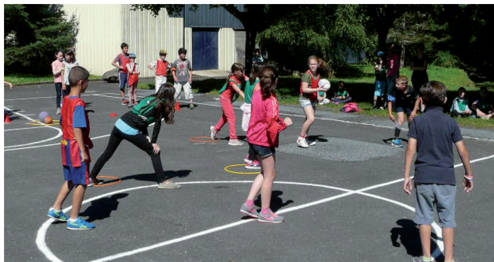
Découverte de jeux à règles.