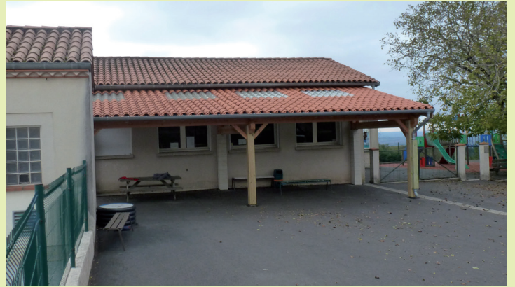
Superbe préau construit pour le plus grand plaisir des enfants de l'école.