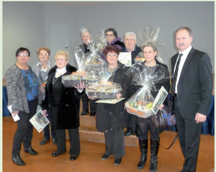
Remise des prix lors des vœux du Maire.