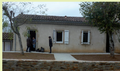
L'accès à la cantine scolaire a été redessiné.