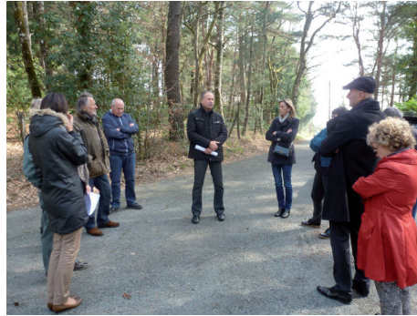
Rencontre avec les administrés concernés par l'ouverture du chemin de Montplaisir.