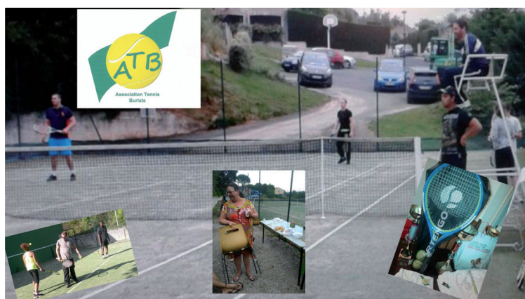
Loisir et convivialité au tennis du lotissement la Boudarié 2.

Tarif unique 25 euros par an et par famille pour jouer en illimité.