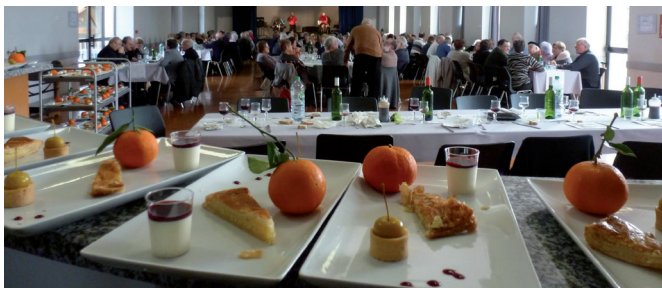
En route pour le dessert.

Participation record ce dimanche 10 janvier alors que le soleil brillait grandement ; tous les élus, accompagnés de quelques conjoints, ont donné de leur personne ce jour-là pour accueillir dignement nos aînés lors du traditionnel repas qui leur est consacré.