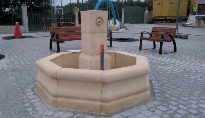
Fontaine de la place.