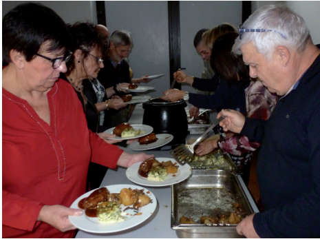
L'équipe municipale était quasiment au complet pour servir le repas des aînés.