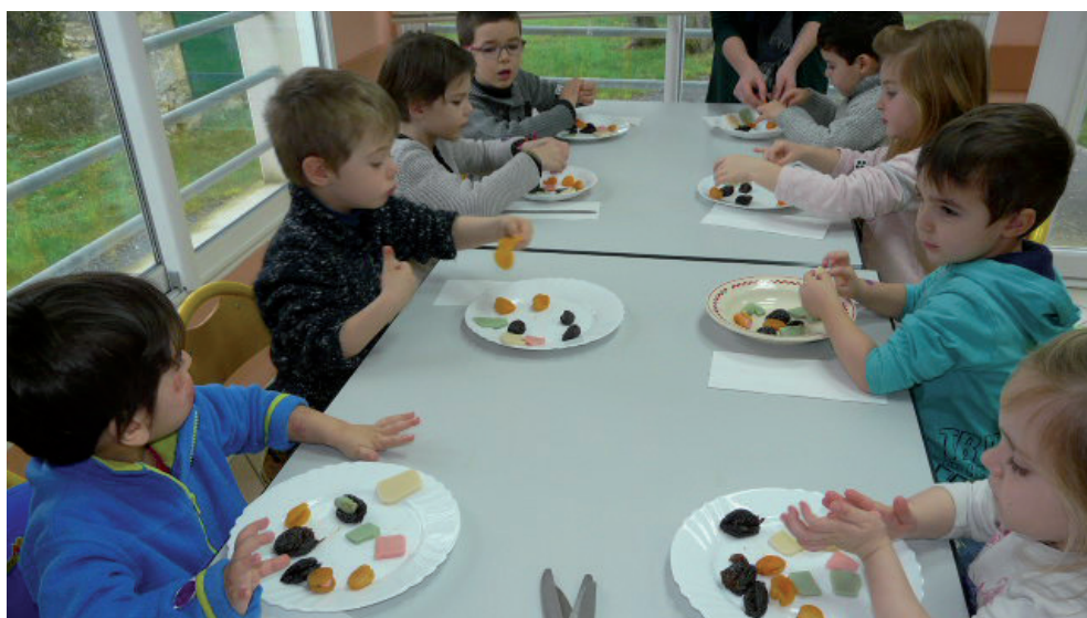
Atelier cuisine pour les petits.

Voici un retour en photos qui illustre quelques actions parmi celles menées lors de l'année scolaire 2015-2016.