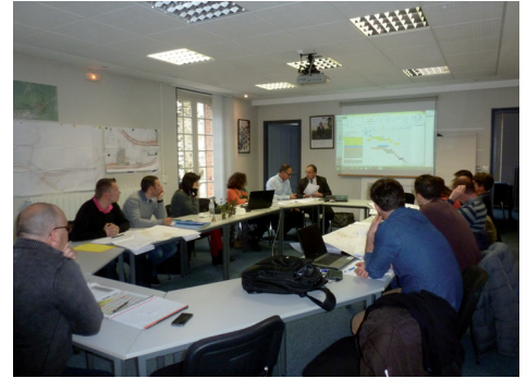
Réunion de travail avec les services départementaux et les entreprises pour le contournement de Lafontasse.