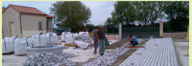
Pavage de la place principale.