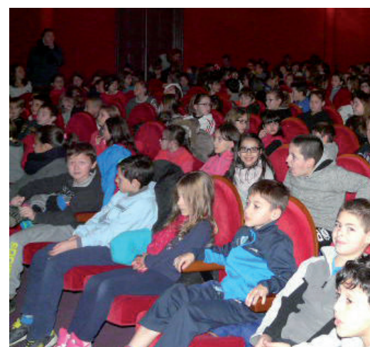
Spectacle au théâtre.