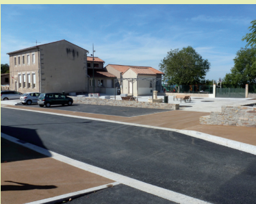
Trottoirs et chaussée repensés et goudronnés.