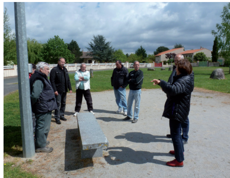
Rencontre avec les habitants du lotissement du Carla.