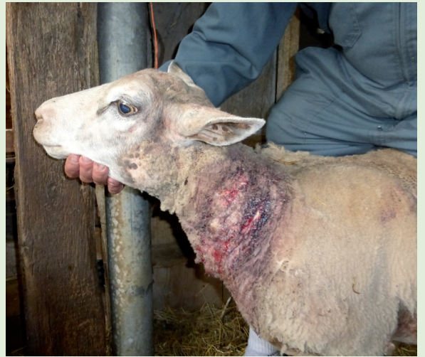
Oeuvre de chiens errants.

Les zones de collecte du tri sélectif ne doivent en aucun cas servir de dépôt d'encombrants.