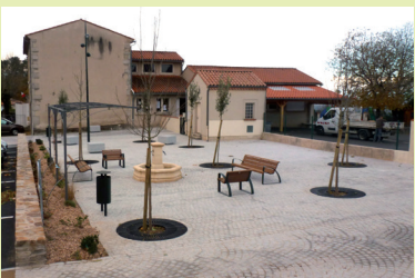
Vue de la place principale terminée.