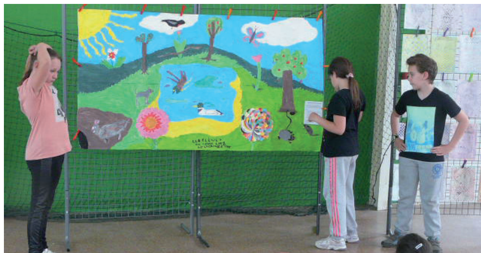
Présentation des travaux aux camarades.