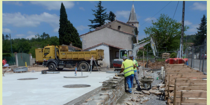
Construction du mur limitant la place de l'école.