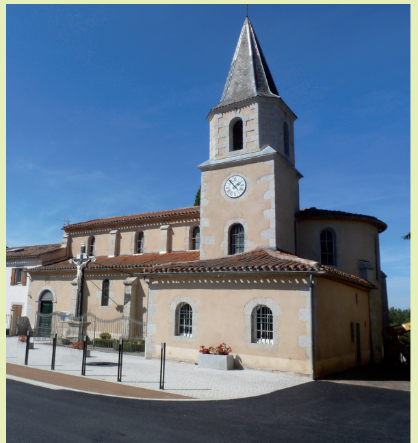
Nouveau visage de la place de l'église.