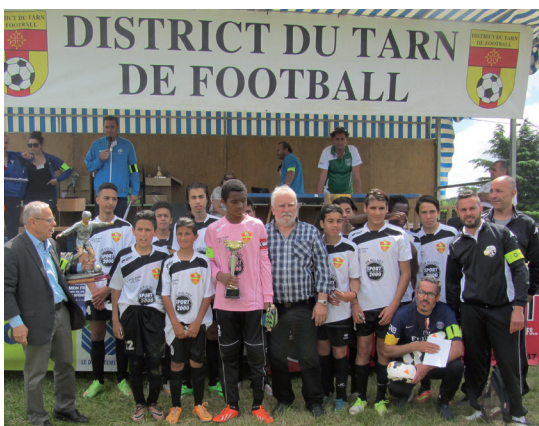
Les footballeurs sur les podiums !

La première satisfaction vient de l'équipe seniors une (Promotion 1 ère division) après son beau parcours en Challenge Manens où les Noir et Blanc échouent en demi-finale contre Pampelonne ! Sans oublier leur excellent Championnat (3e) leur permettant la montée en division supérieure.