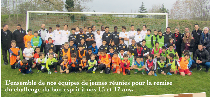
L'ensemble de nos équipes de jeunes réunies pour la remise du challenge du bon esprit à nos 15 et 17 ans.