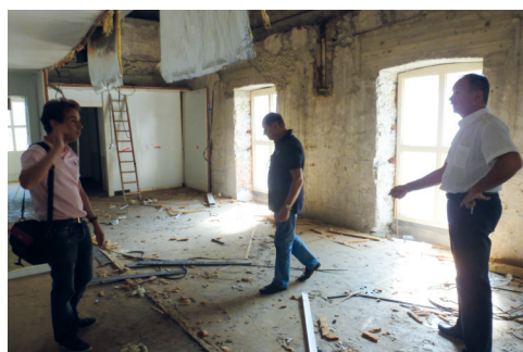
# Dans les locaux de l'ancien CAT pour étude de réhabilitation des lieux.