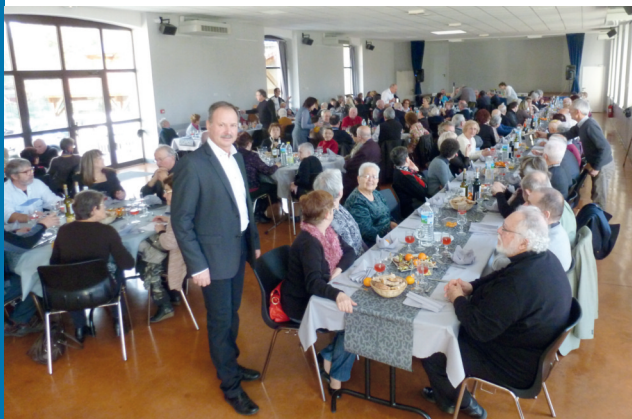
M. le Maire veille à ce que tout se passe bien.

En ce dimanche 11 janvier, 140 séniors s'étaient donné rendez-vous pour le traditionnel repas des aînés organisé par la municipalité.