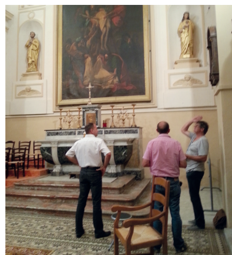
# Avec l'entreprise Biseul pour évaluer les travaux de réparation à l'intérieur de l'église Saint Pierre de Burlats.