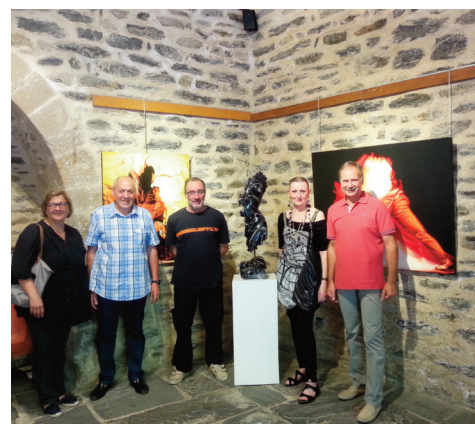
# Lors du vernissage d'une des expositions de la saison au pavillon Adélaïde.