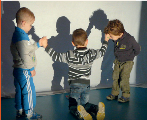
Rencontre ombre et lumière