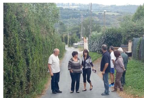
# Sur la route de la Massalarié pour étudier les difficultés de circulation.