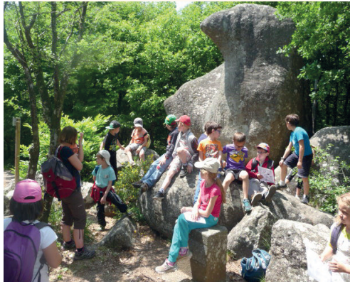
Sortie dans le Sidobre