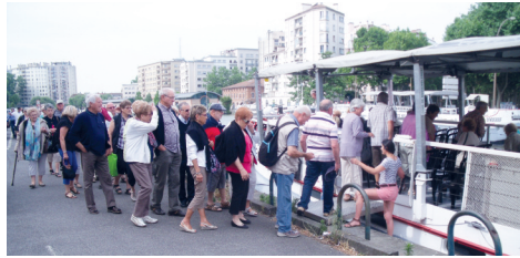
Embarquement pour découvrir le Canal du Midi et ses écluses.

Un seul souhait, que ce dynamisme continue les années à venir.