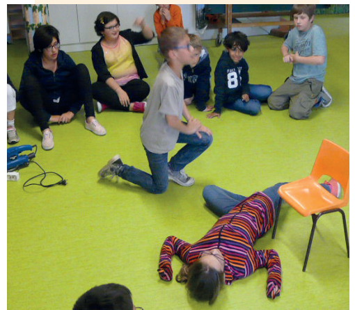
Formation aux premiers secours