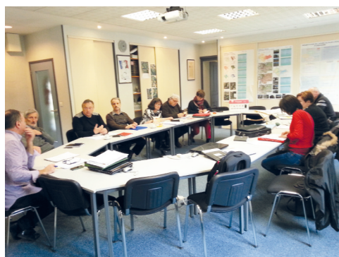
# Tous les 15 jours, réunion des élus sous la présidence de M. le Maire.