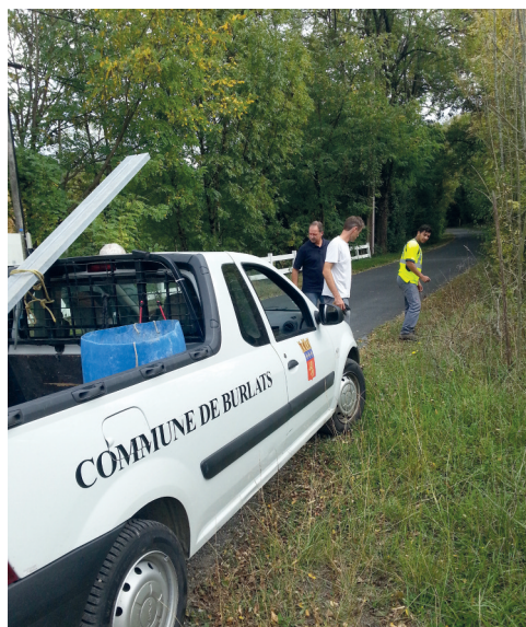
# Au Lézert, pour déterminer l'emplacement de panneaux routiers.