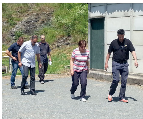
# Au stade avec les différents partenaires pour la reconstruction du local du club de football.