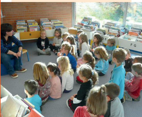
Sortie à la bibliothèque de Castres