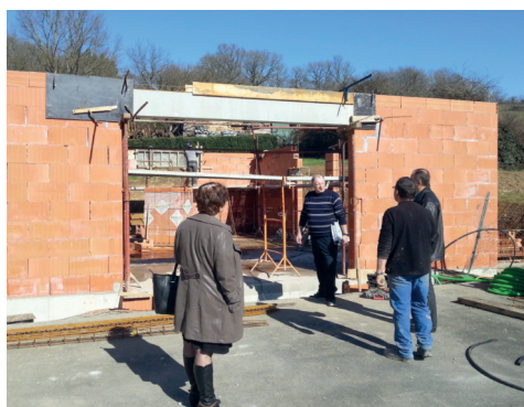
# Suivi des travaux de l'extension de l'école des Vignals.