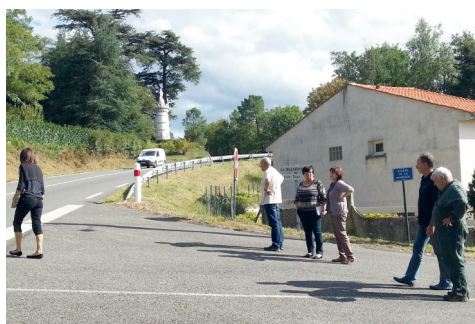
# A la Bourdarié 1 pour étude de travaux de sécurisation de la sortie du lotissement.