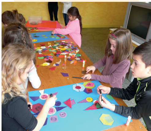
Rencontre arts visuels