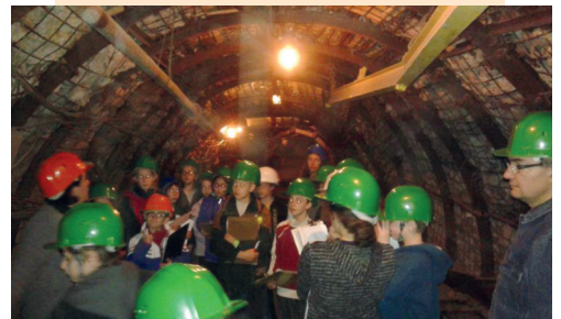
Visite musée de la mine et de la découverte