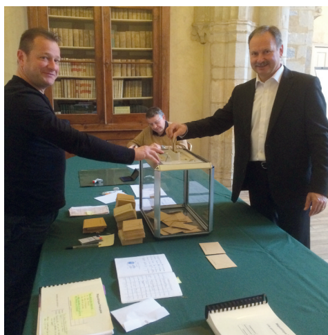
# Mobilisation générale lors des élections départementales de mars et régionales de décembre.