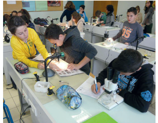
Sciences au collège