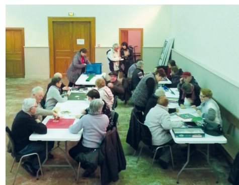
# Avec les séniors pour la mise en place des activités du jeudi au temple des Salvages.