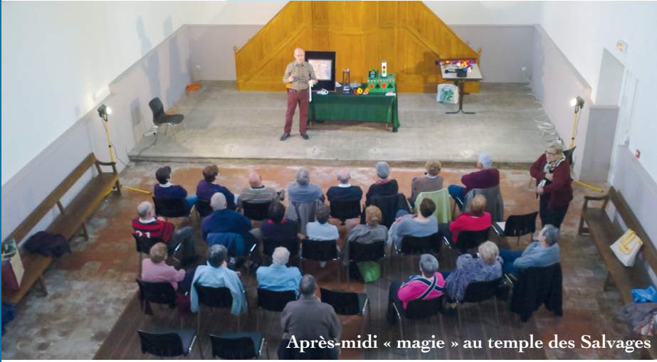
Après-midi « magie » au temple des Salvages

2015 est l'année de création d'un Club des Aînés à Burlats, suite à un questionnaire établi afin de matérialiser leurs attentes. La présentation s'est faite autour de la galette des rois offerte par la Mairie.