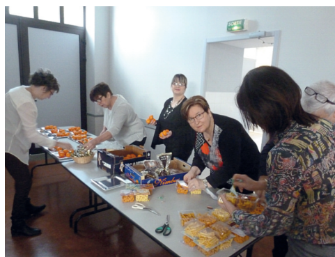
# Au repas des aînés, ces dames préparent les assiettes.

Participation aux nombreuses réunions, présence lors des différentes manifestations, déplacement sur le terrain, organisation d'évènements, voici un aperçu non exhaustif des activités des élus.