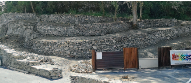
Vue d'ensemble des terrasses rebâties.