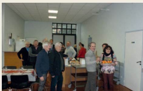
# Les élus se mobilisent pour organiser et servir le traditionnel repas des aînés.