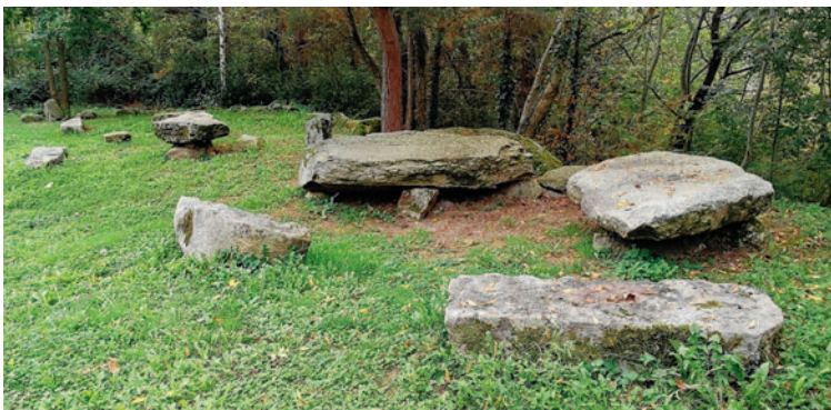
L'aire du Triol vous offre un lieu de repos et de détente.

Du côté de la grotte St Dominique, le promeneur peut rencontrer une splendide statue-menhir (voir couverture) sur laquelle sont concentrés tous les attributs découverts sur l'ensemble des pierres mégalithiques de la région. En face, une aire de repos et de pique-nique verdoyante pourra vous accueillir. Non loin de là, un aménagement a été réalisé pour accéder au désormais célèbre « Roc du Batistou » et des plantations de ceps de vigne rappellent le terroir local passé.