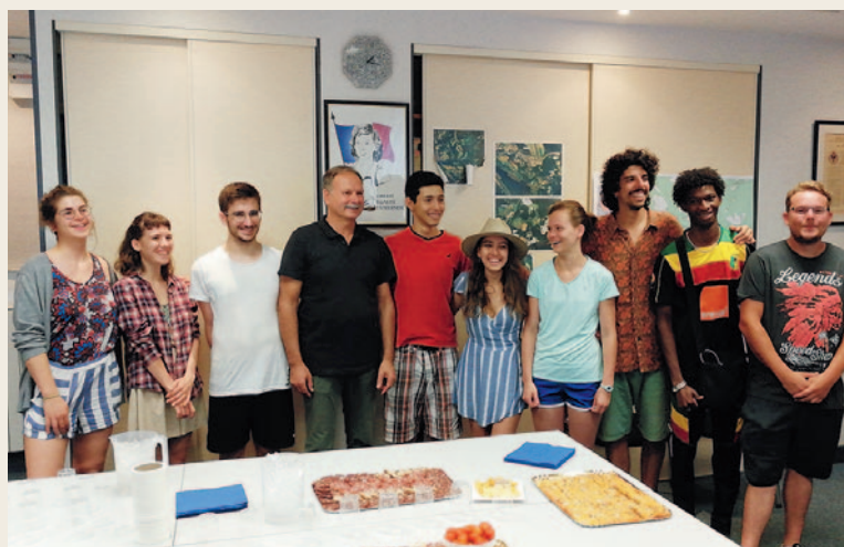
# Accueil des jeunes bénévoles du groupe Concordia venus réaliser le chantier de réhabilitation des murs en pierre sèche des anciennes terrasses.