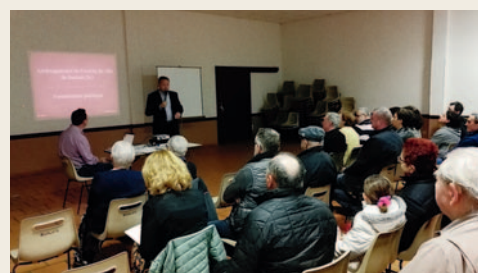
# Rencontre avec la population concernant l'aménagement de l'entrée de Burlats.