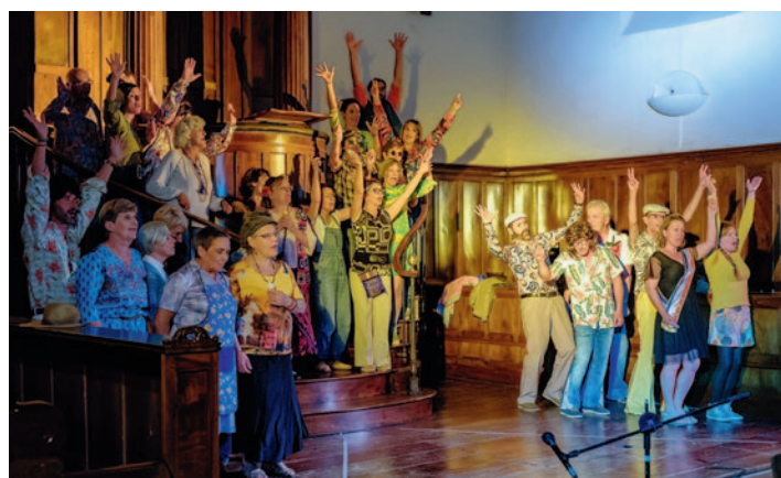
« Un repas de gala » au temple de Castres.