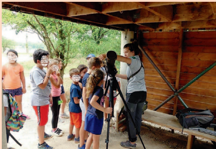
Découverte réserve naturelle et orientation au DICOSA.

En 2019, l'augmentation de certaines dépenses, natation et amortissements notamment, nous a contraints à réduire les sorties scolaires. A la demande du coordonnateur du réseau, les municipalités ont pris la décision d'augmenter leur participation financière ; qu'elles en soient ici remerciées. Cela devrait permettre à l'équipe enseignante de pouvoir de nouveau proposer des sorties.