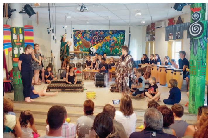
En colonie à Burlats.