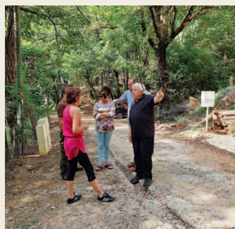
# Suite à des problèmes de ruissellement d'eaux pluviales, rencontre avec les administrés concernés pour solutionner le problème.