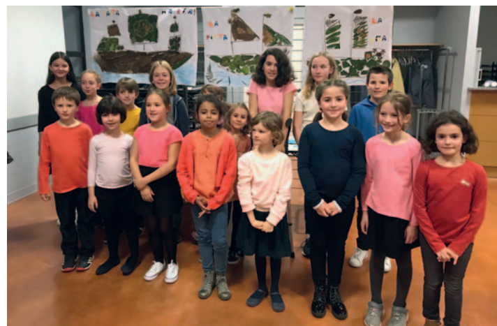
Stage choral d'automne.

Le Moulin des Sittelles propose ainsi à des choristes amateurs d'adhérer aux Chœurs des Sittelles pour s'exercer au travail vocal traditionnel et pour goûter à l'expérience du spectacle vivant.