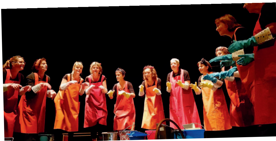
Choeur de femmes : spectacle « du ballet ».