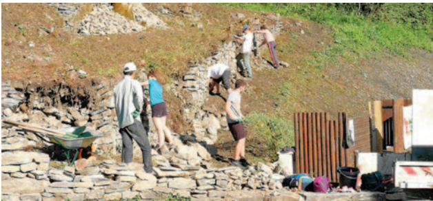
Réhabilitation des terrasses par les jeunes volontaires.

La mission des jeunes volontaires bénévoles venus des quatre coins du monde consistait à la remise en état des murs en pierre sèche des anciennes terrasses mises à jour par les agents municipaux lors du débroussaillage du futur parking à Burlats. Ces jeunes, sous la tutelle de l'association Concordia, ont mené à terme ce projet de façon remarquable en trois semaines.