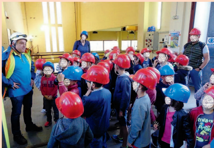
A la centrale électrique de Luzières.