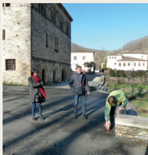
# Déplacement en différents lieux de la commune pour localiser précisément l'implantation de cendriers (voir photo), de panneaux routiers, etc ...