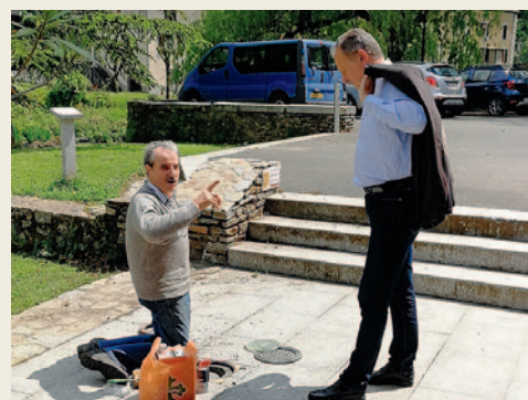
# Les élus n'hésitent pas à donner de leur temps et à mettre leurs compétences au service de la collectivité.