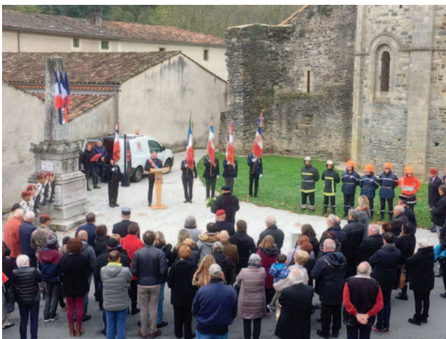
Recueillement au monument aux morts.