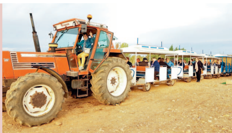
En voiture tout le monde.