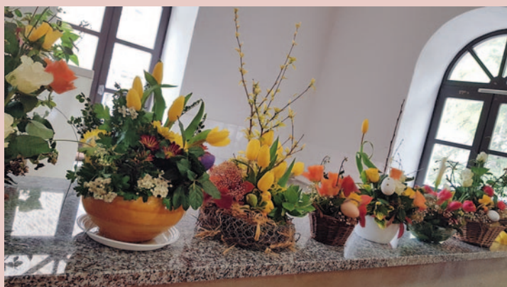
Atelier de printemps de l'art floral.

Des matinées de marche sont proposées sur nos chemins de campagne afin de maintenir notre forme physique, au gré de chacun. De petits repas amicaux, auberge espagnole, sont ponctuellement au programme à diverses occasions, et un goûter anniversaire pour les adhérents est au programme chaque mois.