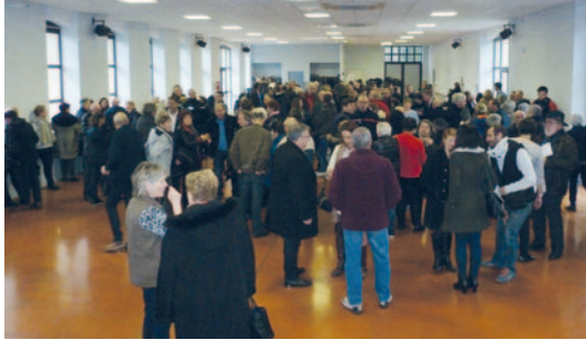
Public nombreux pour la cérémonie des vœux.