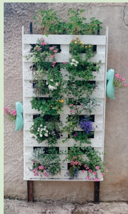
Une jardinière originale.