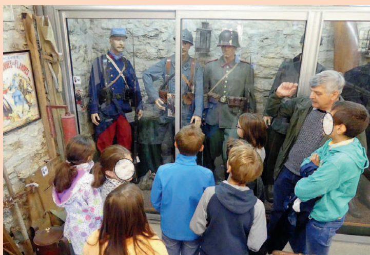
Au musée du militarial à Boissezon.