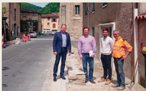
# Réunion hebdomadaire de suivi de chantier de l'entrée de Burlats avec le maître d'œuvre et l'entreprise.