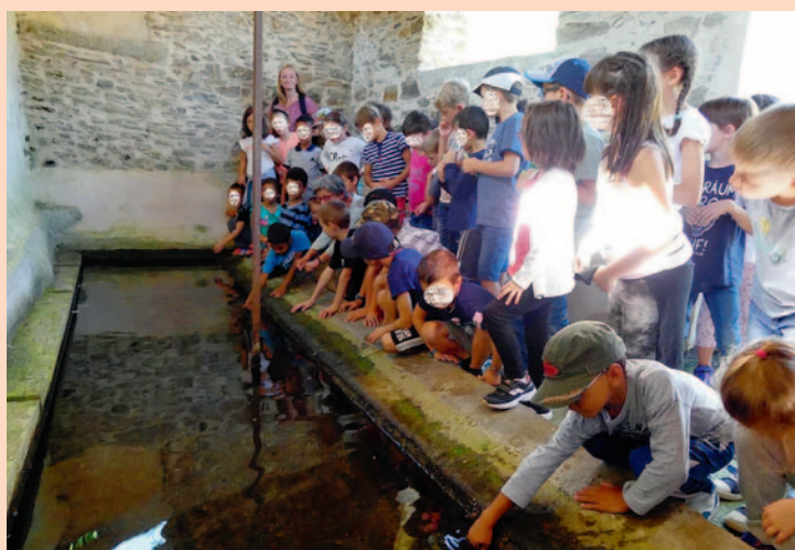
Circuit des lavoirs à Vabre.