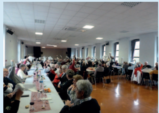
Et on fait tourner les serviettes !