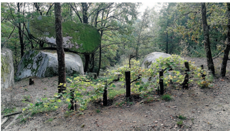
Mise en valeur du roc du Batistou.