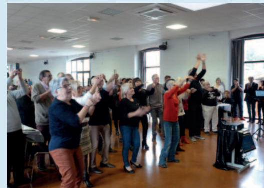
Tous debout pour chanter avec Johnny.