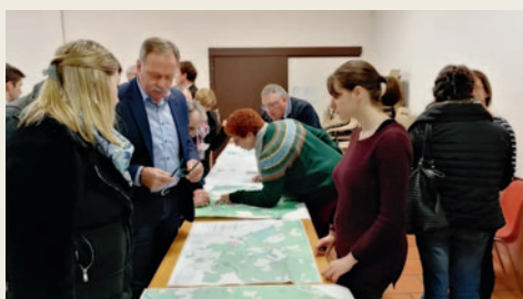
# Présentation aux habitants de la commune des cartes du Plan Local d'Urbanisme Intercommunal.