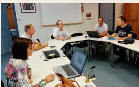
# Rencontre avec les techniciens de SFR pour le déploiement de la fibre optique.