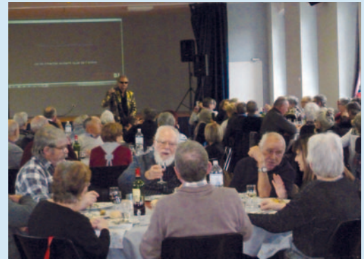
De l'animation tout en se restaurant.

La fin d'après-midi arrivant, nos aînés se séparèrent en remerciant la municipalité pour cette journée de convivialité et de retrouvailles.