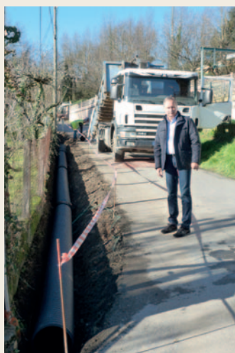
# Sur site pour contrôler l'avancement des travaux en cours.