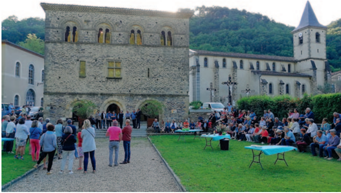
Toujours beaucoup de monde au vernissage de l'expo des « peintres du moulin ».

Pas moins de 7 expositions se sont succédé d'Avril à Octobre. La programmation, sous la houlette d'Eliane Salvat de Niort, permit aux artistes (peintres, photographes et sculpteurs) d'exposer leurs œuvres dans ce lieu unique qu'est le pavillon Adélaïde. Plus de 5000 visiteurs fréquentèrent au cours de la saison ces expositions dont l'entrée est gratuite.