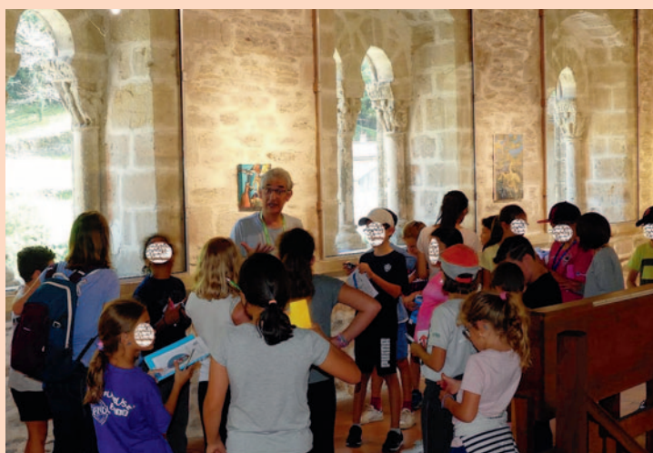
En visite à Burlats.