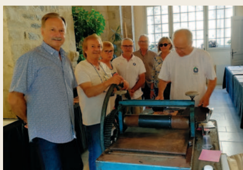
# Même le week-end, les élus se déplacent pour soutenir les artistes lors de la démonstration de l'art de la xylogravure.