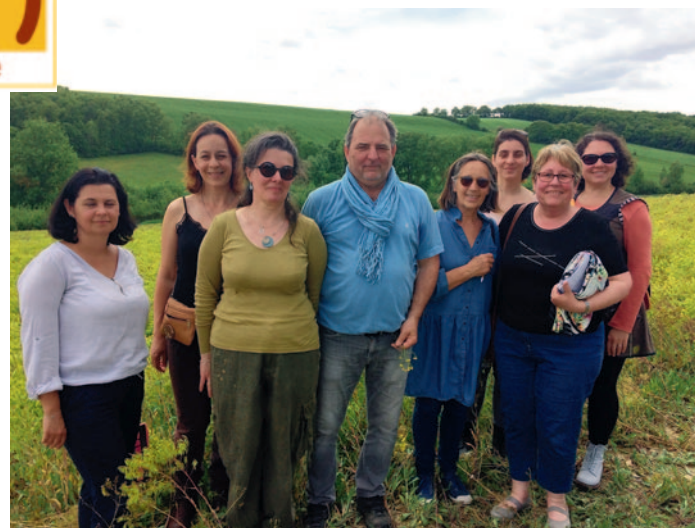
Créateurs en visite guidée sur les champs de pastel.

L'Art et la Matière est adhérente à l'association « Les Ambassadeurs du Pastel à Castres » et en conversion vers l'utilisation du bleu de pastel du Château des Plantes dans ses créations.