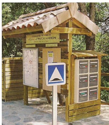
Exemple d'habillage de batterie de boîtes aux lettres sur la commune de Fabras

Ainsi, à l'entrée de certains chemins privés desservant plusieurs administrés ou à l'intérieur même de petits hameaux, nous effectuons des démarches pour l'installation de batteries de boîtes aux lettres. Bien sûr, les habitants concernés seront informés de leur nouvelle adresse. Ils recevront gratuitement les documents nécessaires pour procéder aux modifications de changement d'adresse.